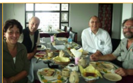
→ TEAMPHOTO :)